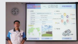
環境改善推進チーム

社長賞 受賞チーム 環境部門：「環境改善推進チーム」(襄陽恩梯恩裕隆傳動系統有限公司) 社会部門：「チームCANADA」(NTN BEARING CORP.OF CANADA LTD.) 社長特別賞 受賞チーム 「NTN Europeチーム」(NTN Europe、NTN 欧州販売、NTN-SNRルーマニア)